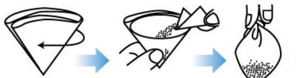
①1枚取り出し4つ折りにする

薬を包み、小皿や小鉢またはくい呑みに少し(50 ml)くらいの水を入れ、その中にいれ、小皿の水ごと飲み込む