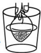
④水につけてすぐ飲む