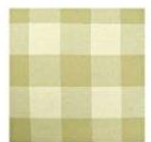
チェックベージュ