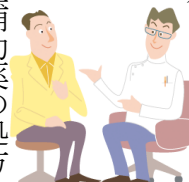
《タバコ代と治療代の比較》

毎回の診察では、禁煙補助薬の処方を受けるほか、息に含まれる一酸化炭素(タバコに含まれる有害物質)の濃度を測定したり、禁煙状況に応じて医師のアドバイスを受けることができます。