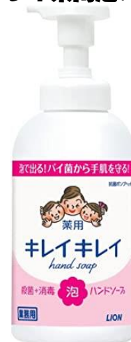
シトラスフルーティの香り