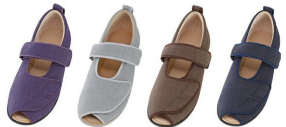
あゆみ製品 サイズ表 cm